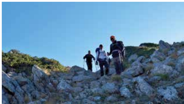
Πλησιάζοντας στο Διάσελο

Βασικός σκοπός της πορείας ήταν η καταγραφή και ακριβέστερη αποτύπωση της διαδρομής αυτής, για να αποτελέσει την ξεχωριστή πρόταση της Καλοσκοπής σε ορειβάτες και περιπατητές που επιθυμούν να χαρούν το βουνό και τη φύση. Η διαδρομή αυτή αποτελεί την πιο ήπια και πιο ενδιαφέρουσα πρόσβαση στο Καταφύγιο του Πεζοπορικού Ομίλου Αθηνών αλλά και μια εναλλακτική πρόταση είτε για την κατάβαση της πανέμορφης χαράδρας της Ρεκάς, είτε για ανάβαση στην Πυραμίδα της Γκιώνας.